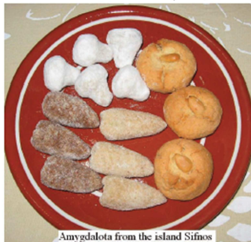
Amygdalota from the island Sifnos

Almonds are consumed fresh (salted, roasted,