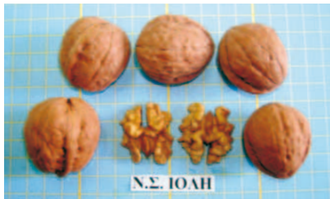
Ξηροί καρποί και ψίχα της ποικιλίας Ιόλη.

Προτείνεται ως κύρια ποικιλία για πεδινές και ημιορεινές περιοχές, όπου ο τελευταίος παγετός σημειώνεται έως αρχές Απριλίου. Υπερτερεί σαφώς όλων των πρώιμων και μεσοπρώιμων καλλιεργούμενων ποικιλιών: Amigo, Serg, Gustine, Vina, Ηλιάνα, Pedro κ.λπ. σε πολλά χαρακτηριστικά.