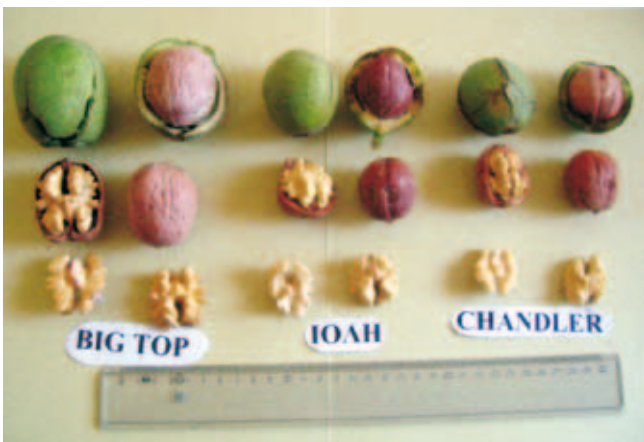
Σύγκριση φρέσκων καρπών και ψίχας των δυο νέων ποικιλιών και της Chandler.

Στη συνέχεια παρουσιάζονται τα χαρακτηριστικά δύο νέων πλαγιόκαρπων ποικιλιών καρυδιάς, της Ιόλης και της Big Top. Πρόκειται για δύο πολύ ενδιαφέρουσες νέες ποικιλίες οι οποίες θα εγγραφούν προσεχώς στον Εθνικό Κατάλογο Ποικιλιών.