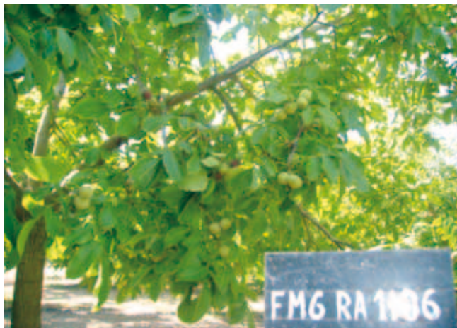
Δένδρο της ποικιλίας Ιόλη.