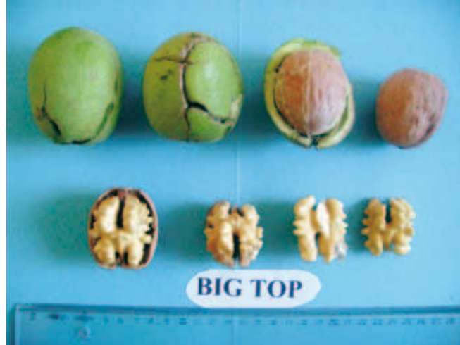
Φρέσκοι καρποί και ψίχα της ποικιλίας Big Top.