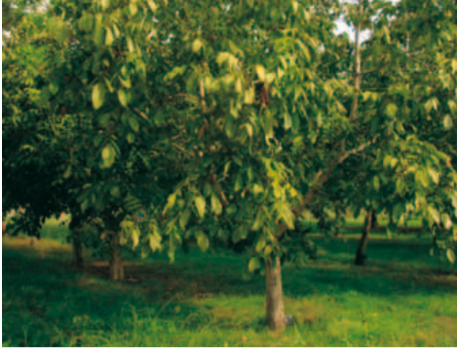
Το μητρικό δένδρο της Big Top.