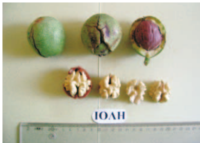
Φρέσκοι καρποί και ψίχα της ποικιλίας Ιόλη.

Σχήμα καρδίου με κέλυφος: σφαιροειδές έως ελαφρά ελλειπτικό.