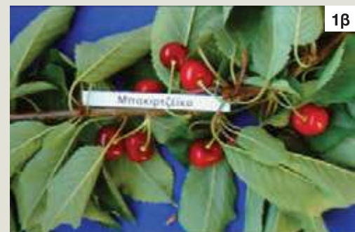
Εικ. 1α, 1β: Καρποί ποικιλίας Μπακιρτζέικα.