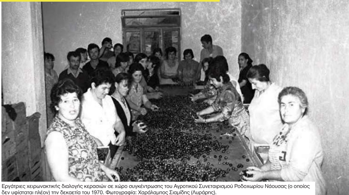
Εργάτριες χειρωνακτικής διαλογής κερασιών σε χώρο συγκέντρωσης του Αγροτικού Συνεταιρισμού Ροδοχωρίου Νάουσας (ο οποίος δεν υφίσταται πλέον) την δεκαετία του 1970.

ΕΛ.Γ.Ο. «ΔΗΜΗΤΡΑ», Ινστιτούτο Γενετικής Βελτίωσης και Φυτογενετικών Πόρων, Τμήμα Φυλλοβόλων Οπωροφόρων Δένδρων Νάουσας.