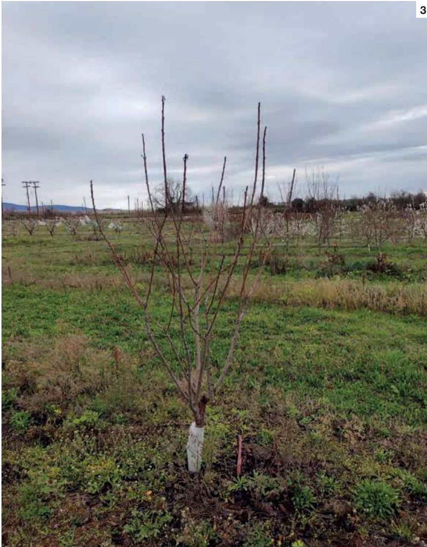
Εικ. 3: Νεαρό δέντρο προερχόμενο από γενετικό υλικό των “Τραγανών Ροδοχωρίου” στις συλλογές του Τ.Φ.Ο.Δ. στη Νάουσα.

τική ομάδα του Ινστιτούτου Γενετικής Βελτίωσης και Φυτογενετικών Πόρων (Ι.Γ.Β.&Φ.Π.) του ΕΛ.Γ.Ο.-ΔΗΜΗΤΡΑ επαναλληλούχησε με σύγχρονες γονιδωματικές τεχνολογίες τα γονιδιώματα από 21 γενοτύπους, συμπεριλαμβανομένων των “Τραγανά Εδέσσης” και “Τραγανά Ροδοχωρίου” (Χανθορούλου et al., 2020). Από τα αποτελέσματα προκύπτει ότι οι δύο γενότυποι είναι στενά συγγενικοί καθώς διαφοροποιούνται σε μικρό αριθμό νουκλεοτιδικών βάσεων του DNA ( Σχεδιάγραμμα 1 ).