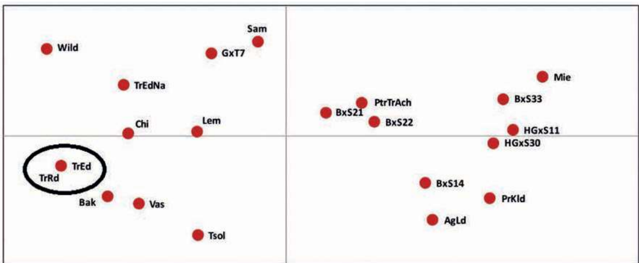
Σχεδιάγραμμα 1: Απεικόνιση της θέσης των γενοτύπων βάσει της γονιδωματικής τους ανάλυσης. Φαίνεται ότι η μοριακή τοποθέτηση των “Τραγανών Εδέσσης” (TrEd) και “Τραγανών Ροδοχωρίου” (TrRd) συμπίπτει.

Η σχετική βιβλιογραφία βρίσκεται στη διεύθυνση : bibliography.agrotypos.gr , έτος 2023, τεύχος 9.